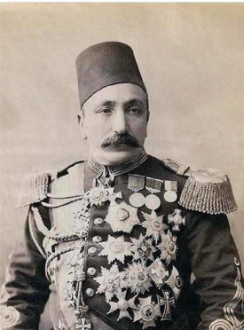
Şeker Ahmet Paşa (1841-1907)