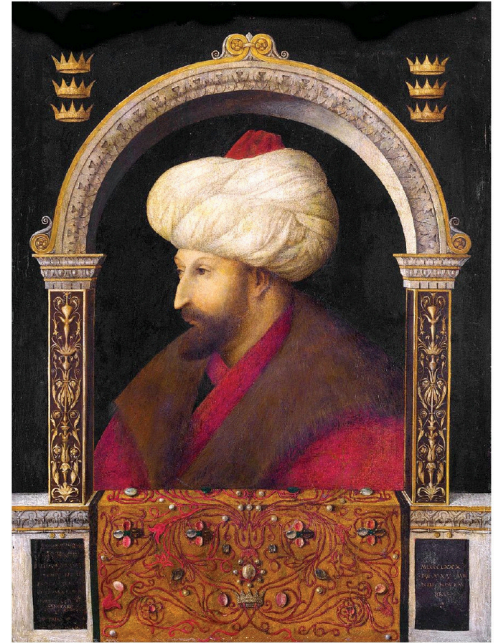
Bellini'nin Fatih Sultan Mehmet Portresi

Ünlü ressam bu son sözü söyledikten sonra gözlüklerini çıkardı. Sildi. Gözleri belirsiz bir ikinci vakti gibiydi.