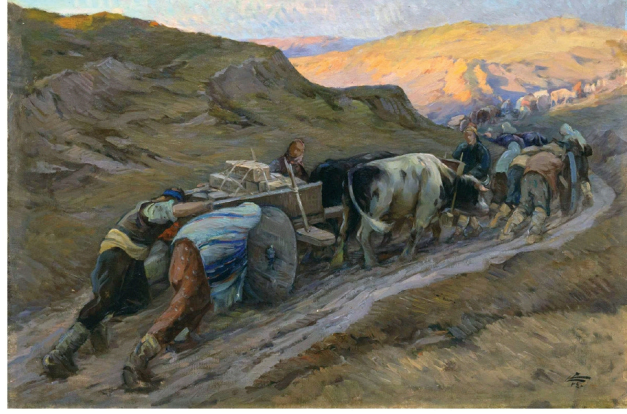
Cephane taşıyan Köylüler