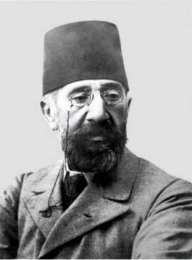
Osman Hamdi Bey (1842-1910)