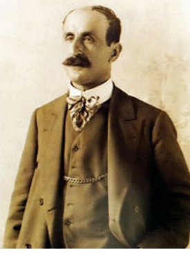
Sami Yetik (1878-1945)

Türk ressamlarına ait aşağıdaki resimleri inceleyiniz. Bu resimlerden hangisini daha çok beğendiniz? Nedenleriyle birlikte açıklayınız.