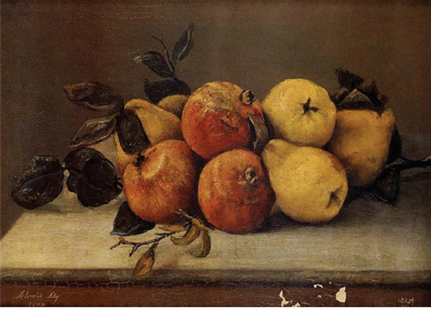
Narlar ve Ayvalar Tablosu Şeker Ahmed Paşa (1841-1907)

Ressam, resmini bitirdikten sonra resmin kendisine ait olduğunun bilinmesi için resmin altına imzasını atarak resmi yaptığı tarihi yazar. İmza bir bakıma kişinin kimliğidir. Aşağıdaki imza örneklerini ve imzalı resmi inceleyiniz. İmzayla ilgili verilen bilgileri okuyarak öğretmeninizin rehberliğinde çizim alanına imzanızı atınız.