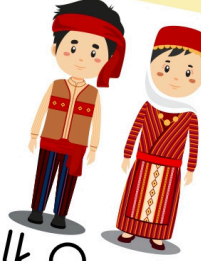
Halk Oyunları Kıyafetleri