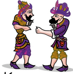
Karagöz ve Hacivat