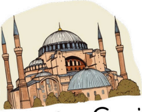
Ayasofya Cami İstanbul